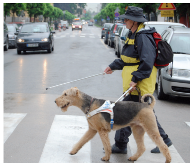
Blindenführhund «im Dienst» und in der Therapie