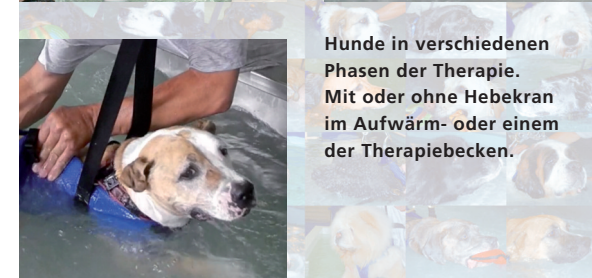
Hunde in verschiedenen Phasen der Therapie. Mit oder ohne Hebekran im Aufwärm- oder einem der Therapiebecken.